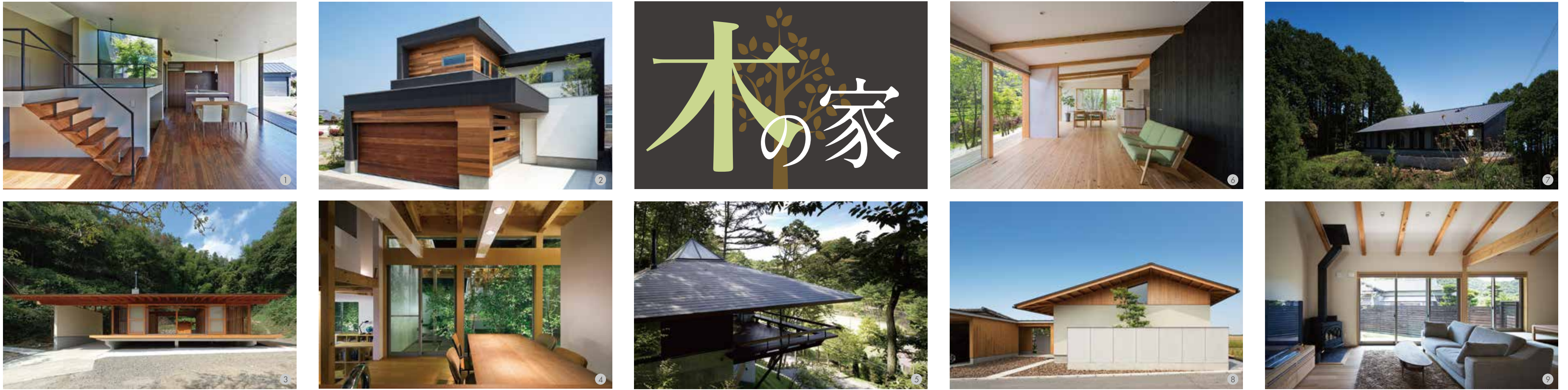
使用写真:①「常陸太田の家」設計:丸山耕平 撮影:益永研司 ②「重なり合う家」設計:佐藤正彦 撮影:石井紀久 ③「夢創庵」設計:河口佳介 撮影:下川高広 ④「湯浅のコートハウス」設計:平岡孝啓・平岡美香 撮影:富田英次 ⑤「浅向荘」設計:山本学 撮影:上田宏 ⑥「OPEN HASAMI」設計:吉武研二 撮影:石井紀久 ⑦「熊野の平屋」設計:福田浩明 撮影:富田英次 ⑧「佐賀高木瀬の家」設計:吉武研二 撮影:石井紀久 ⑨「日高の平屋」設計:福田浩明 撮影:富田英次